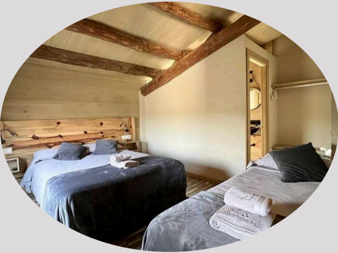
Habitación con dos camas y baño (1)