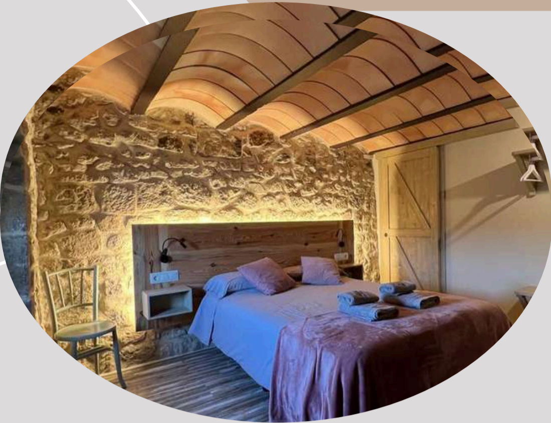
Habitación individual con baño (2)