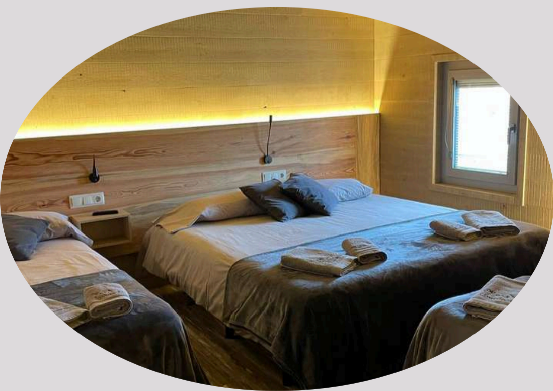
Habitación triple con baño (2)