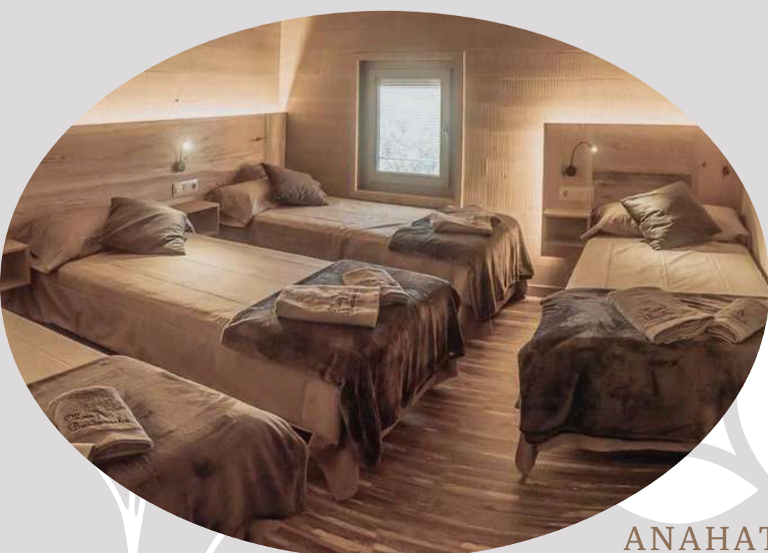
Habitación cuádruple con baño (1)